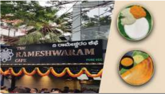
Rameshwaram Cafe Goes Global

ಬಾಗಲಕೋಟೆ ಹೋಟೆಲ್ ಮತ್ತು ಉಪಹಾರ ಮಂದಿರ ಸಂಘದ ನೂತನ ಕಾರ್ಯಕಾಲಿ ಸಮಿತಿ