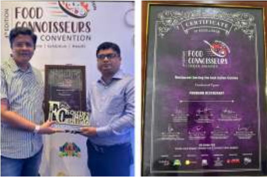
Pakwan Hotel Bagalkot Receiving Best Connoisseurs award