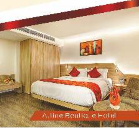
Alice Boutique Hotel