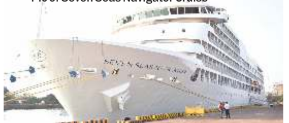
Pic of Seven Seas Navigator Cruise

While in Mangaluru, tourists were exposed to cultural programs, taken to touristic sites in and around Mangaluru including, to Moodabidri, Karkala, iconic religious sites, served delectable local cuisine and also taken around for shopping at some famous local eateries. The day was well spent soaking the local sights and experiences, hopefully sufficient to create a lasting impression on our visiting guests about that part of our State. With 10 cruise vessels scheduled to arrive at Mangaluru during the current season, is indicative of the growing popularity of New Mangalore as a compelling cruise destination. This influx of tourists via waterways at the port, is anticipated to contribute significantly to the local economy, generating revenue for various sectors, including tourism, hospitality, and transportation.