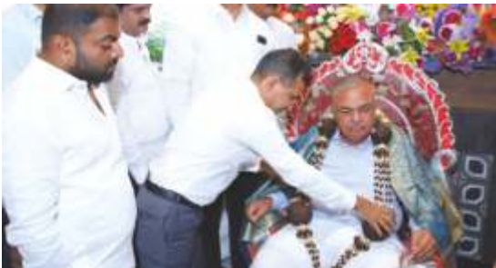
Hon. secretary Honouring Minister Sri Ramalinga Reddy