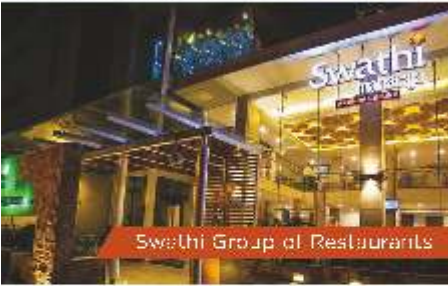
Swathi Group of Restaurants